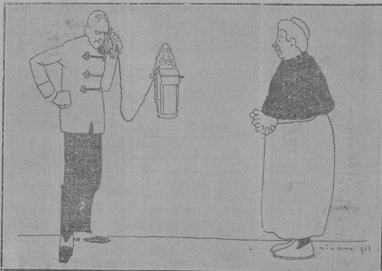
LA SENORA.—Pero, hombre; ¿no estás impaciente? ¡Si no llevas llamando más que tres días...