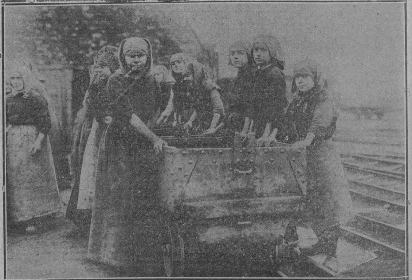
EXTRANJERO.—Obreras de las minas de Charleroi, actualmente en huelga.

Al partir el convoy se oyó una estruendosa ovación y un viva, partido de no se sabe quien, a los dos hombres más valientes de España.