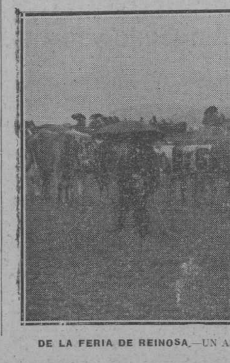
DE LA FERIA DE REINOSA.—UN ASPECTO DEL MERCADO DE GANADO VACUNO