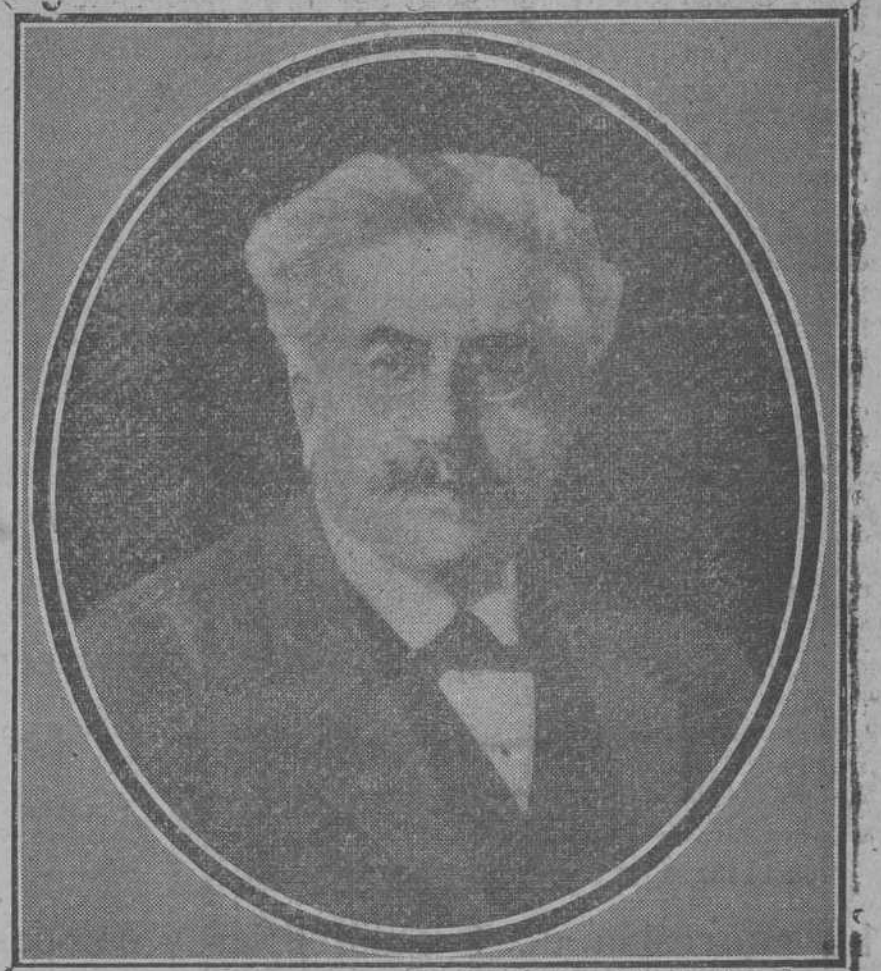
MR. MILLERAND, NUEVO PRESIDENTE DE LA REPUBLICA FRANCESA

El acto ha constituido una verdadera manifestación de duelo.