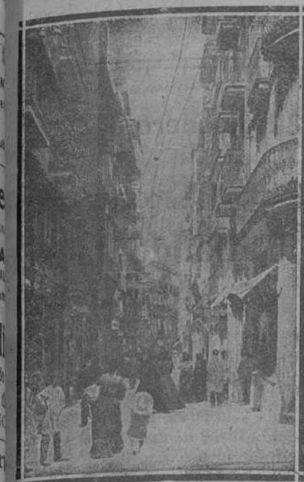
CALLE DE SAN FRANCISCO