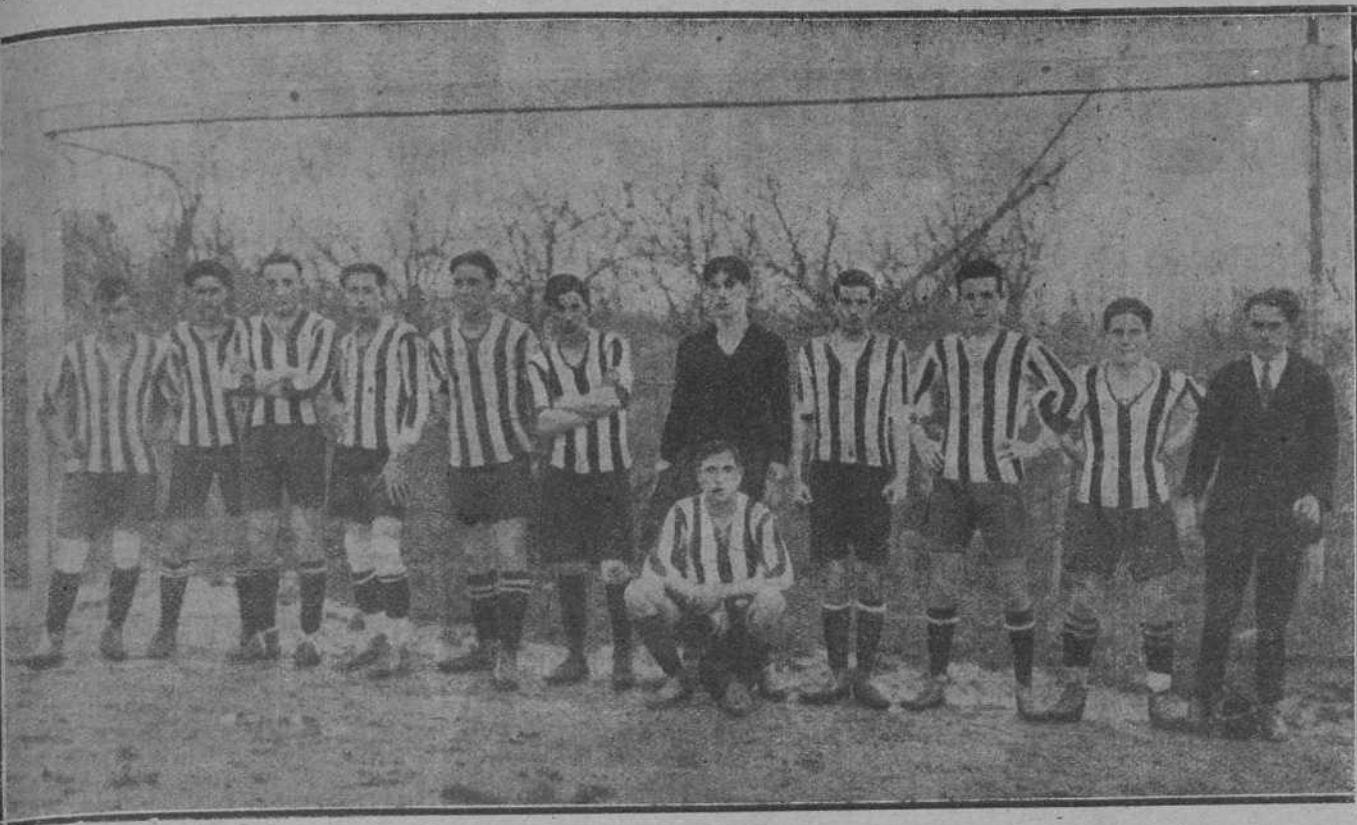
El equipo biltáino «Eranadio», al que venció el «Racing», por uno a cero, en el campo de Etxezuri.