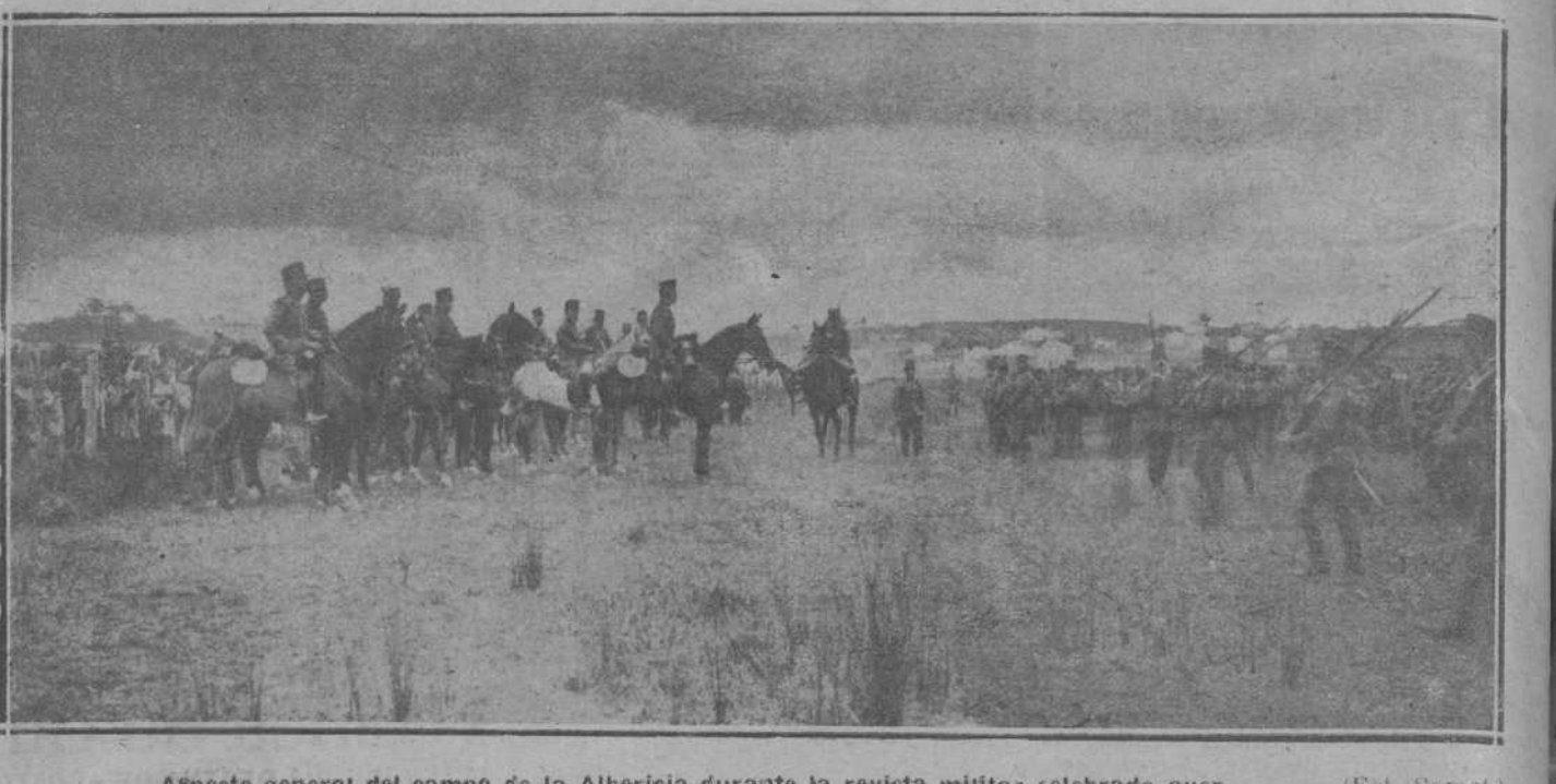
Aspecto general del campo de la Albericia durante la revista militar celebrada ayer.

Dos notas de la Presidencia. MADRID, 6.—En la Presidencia fueron facilitadas hoy a la prensa dos notas. En una de ellas se dice que es inexacto que el subsecretario hiciera manifestaciones en relación con el viaje del Rey a Barcelona. En la otra se hace constar que la Comisión de funcionarios encargada de adoptar la ley de funcionarios no se hace solidaria de ninguna de las versiones que han circulado respecto a la orientación de sus trabajos.