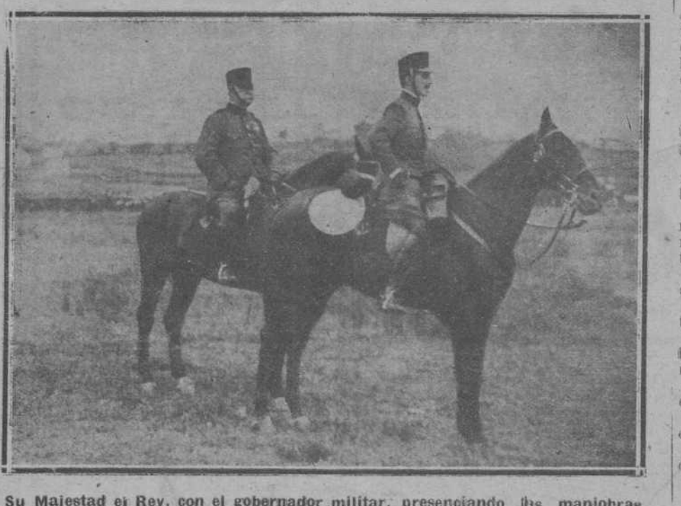
Su Majestad el Rey, con el gobernador militar, presenciando las maniobras celebradas ayer.