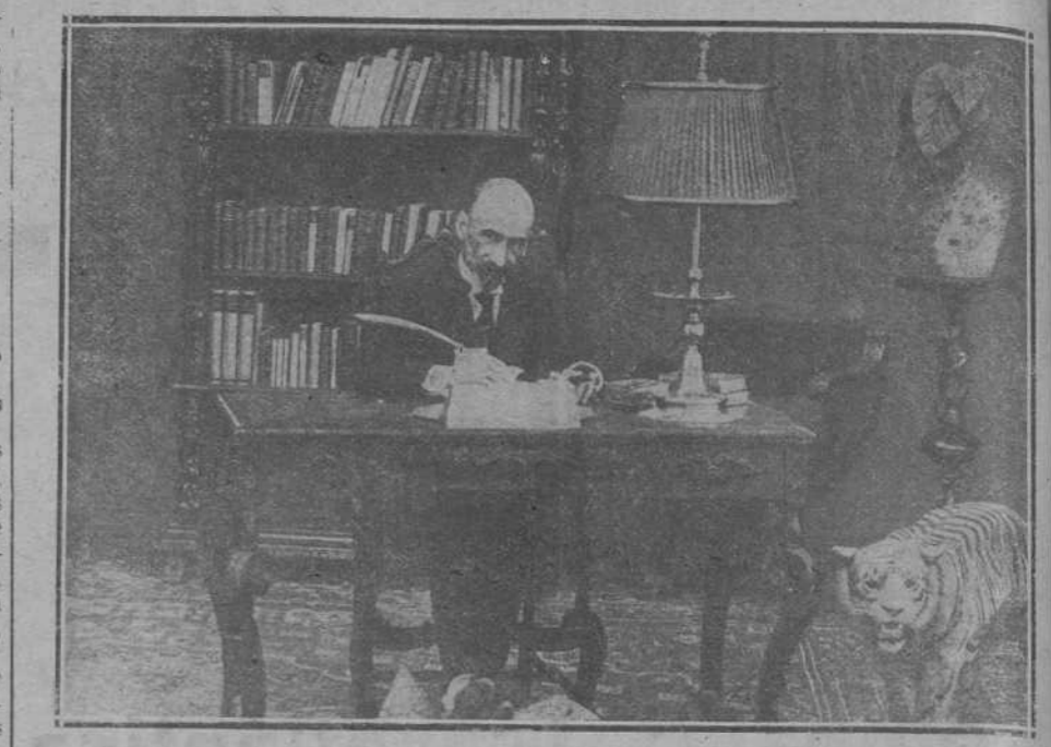
UNA PELICULA NOTABLE.—El glorioso dramaturgo don Jacinto Benavente, autor de la hermosa comedia «Los intereses creados», planeando el desarrollo del argumento para ser trasladado a la película.