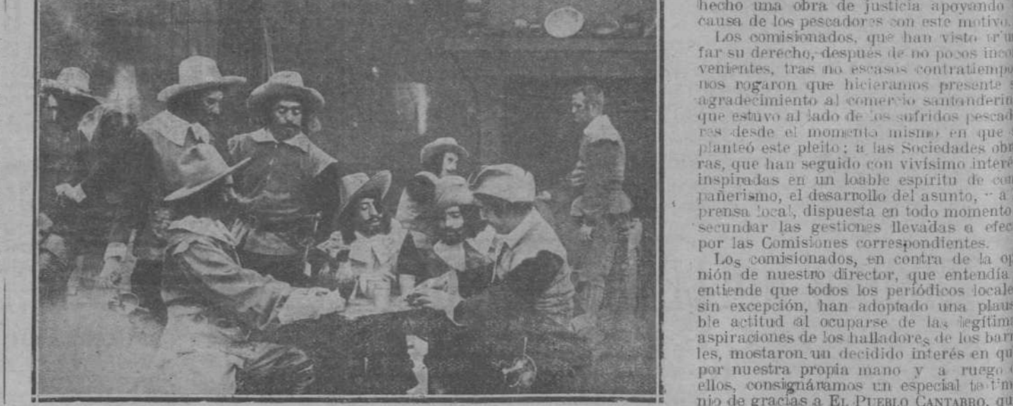
UNA PELICULA NOTABLE.—Una de las escenas más interesantes de la notabilísima película «Los intereses creados», que actualmente se está imprimiendo.

agradecimiento a las personas indicadas y a cuantos contribuyeron a auxilios en su apuradísima situación. Quedan, pues, complacidos los desventurados pescadores, víctimas nuevamente de las intemperancias y de las furias del mar. Una promesa. Nos manifestaron asimismo algunos de los naufragos citados, que en acción de gracias a la Santísima Virgen del Carmen, patrona de los pescadores, que salvó sus vidas en el naufragio aludido, irían uno de estos días al pueblo de Revilla de Camargo, a cumplir una solemne promesa que hicieron en el momento de volcar su embarcación ante el horroroso impulso del mar embravecido por la galerna de anteayer.