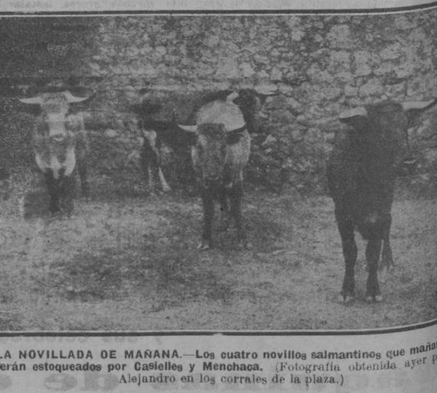
LA NOVILLADA DE MAÑANA.—Los cuatro novillos salmantinos que mañana serán estoqueados por Castiells y Menchaca.