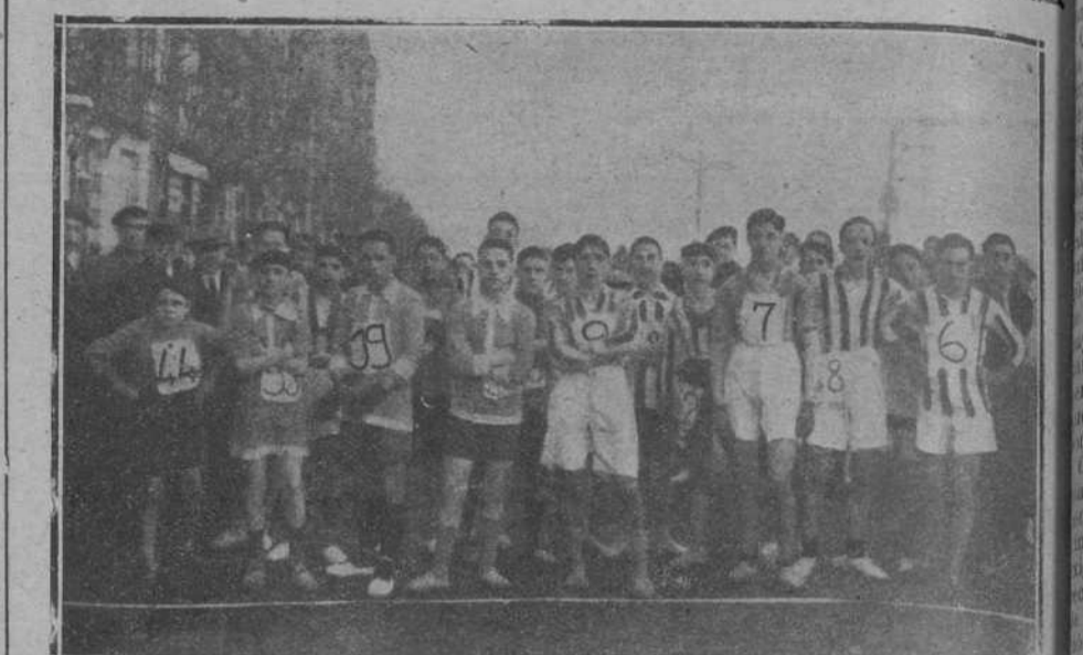
Los corredores que tomaron parte en el «cross-country» celebrado ayer.

En la comitiva se veían, entre otras personalidades, a los señores Maura,