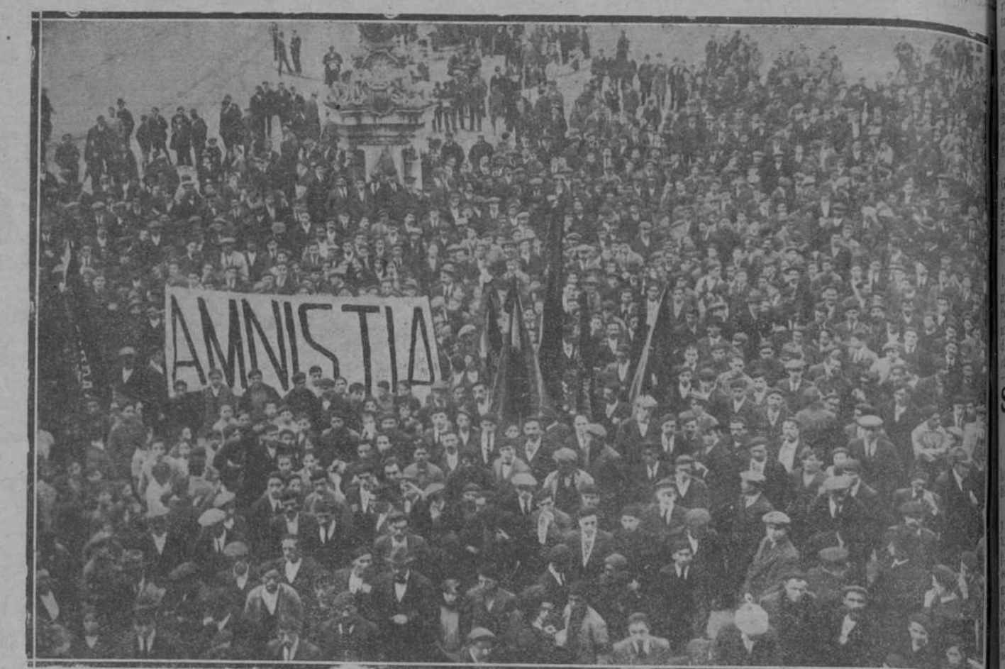
La manifestación de ayer ante el Gobierno civil.