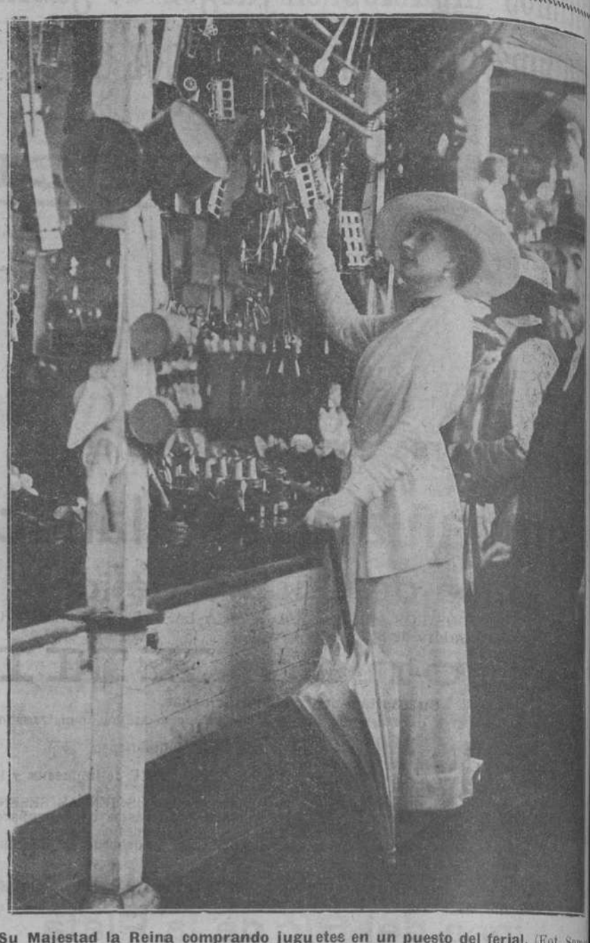
Su Majestad la Reina comprando juguetes en un puesto del ferial.

Por último se precisó conocer el efecto que produce, tanto a la Compañía como a los trabajadores, para dar por liquidado el pleito. En tanto este efecto no se conozca no se restablecerán las garantías constitucionales. Antes no podrá hacerse, y las personas que juzgan las cosas sin presbiterio, encontrarán justo el proceder del Gobierno.