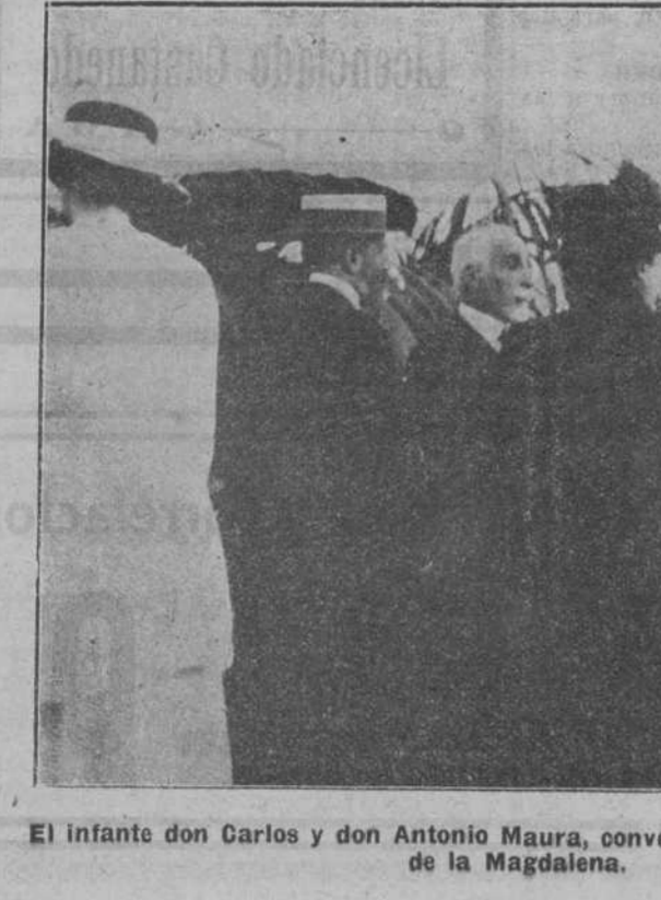
El infante don Carlos y don Antonio Maura, conversando en el campo de polo de la Magdalena.

Las enseñanzas que estamos recibiendo no son, en verdad, para que las gentes propendan a desecular, no tan sólo los institutos profesionales y los instrumentos materiales, sino tampoco las generales organizaciones en que se ha visto que estriba y consiste el poderío militar. Estas enseñanzas tampoco inducirán a desahogar la fuerza, ni fiar a la sola virtud de la justicia y del derecho los bienes que la humanidad tiene, según lo está mostrando, en la mayor estima.