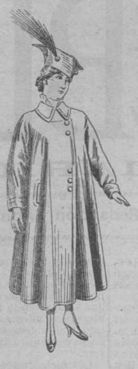
Gabán impermeabilizado, modelo 1916 y 1917. Precio: desde 90 pesetas.