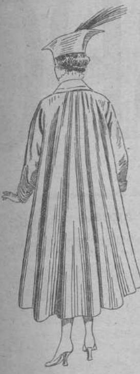
Gabán impermeabilizado inglés, resistente a la lluvia. Modelo de la temporada de otoño, e invierno de 1916 y 1917: desde 85 pesetas.

NOTA.—Se confeccionan trajes para señora, enviando un cuerpo ajustado y medidas, y se sirven con gran rapidez todos los encargos.