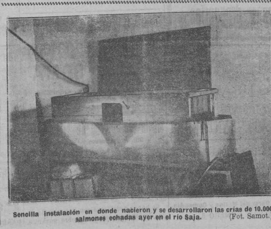
Senella instalación en donde nacieron y se desarrollaron las crías de 10.000 salmones echadas ayer en el río Saja.

Mañana publicaremos una fotografía de un grupo del «Portugalete», que por falta de espacio nos hemos visto precisados a reducir del número de hoy.