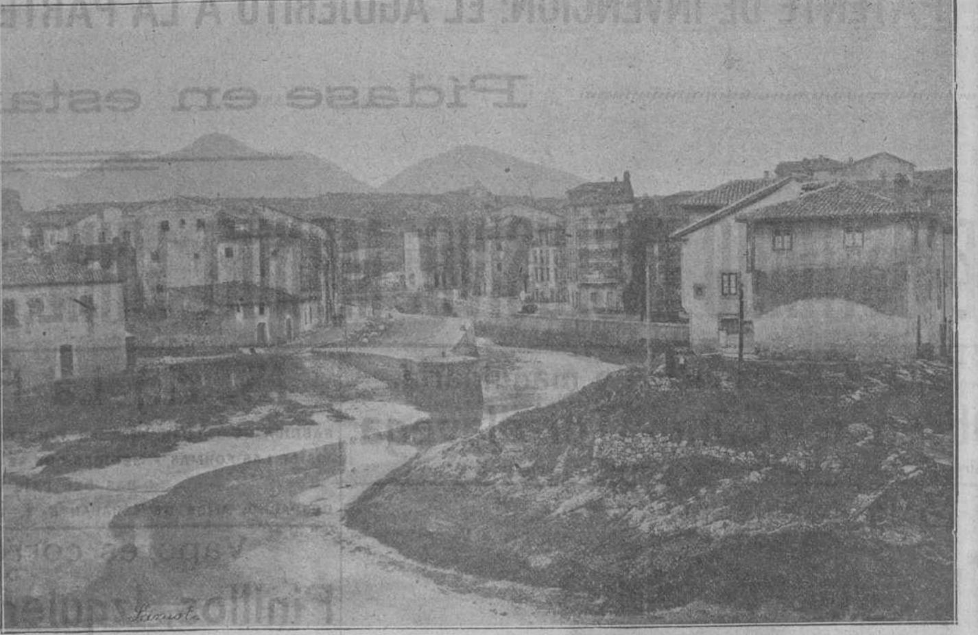
LLANES.—La parte antigua, vista desde el puerto en baja marea.