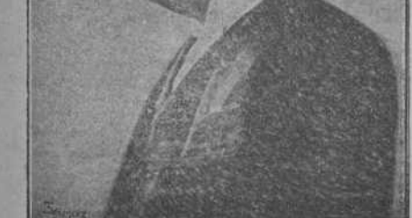
FIGURAS DE LA GUERRA.—El político rumano Take-Jonesco, jefe del partido liberal y uno de los defensores de la neutralidad de su país.

Esta noche se ha celebrado el banquete organizado en honor del escritor señor López de Súa por sus recientes triunfos. Asistieron más de 400 comensales, entre los que figuraban muchos literatos, periodistas, políticos y autores. Presidió el ministro de Instrucción pública. Al final del banquete se leyeron varias adhesiones, entre las cuales figuraba una carta de don Antonio Maura. Al escuchar la lectura de ella todos los