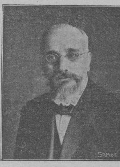
FIGURAS DE LA GUERRA.—El ex presidente del Consejo de Grecia, Venizelos, cuya actuación en favor de los aliados es cada día más firme.