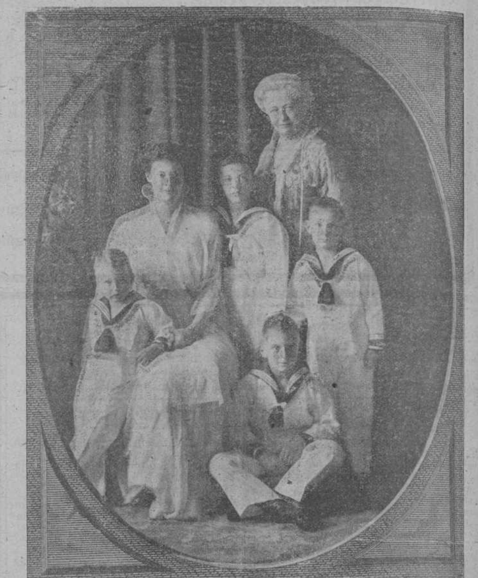
FIGURAS DE LA GUERRA.—Las esposas del Kaiser y del Kronprinz y los niños de Guillermo II.

Resultado muerto un hombre que se supone viajaba entre los topes. El cadáver no ha podido ser identificado. Sufrieron heridos ocho viajeros, tres empleados y los guardias de la escolta del tren.