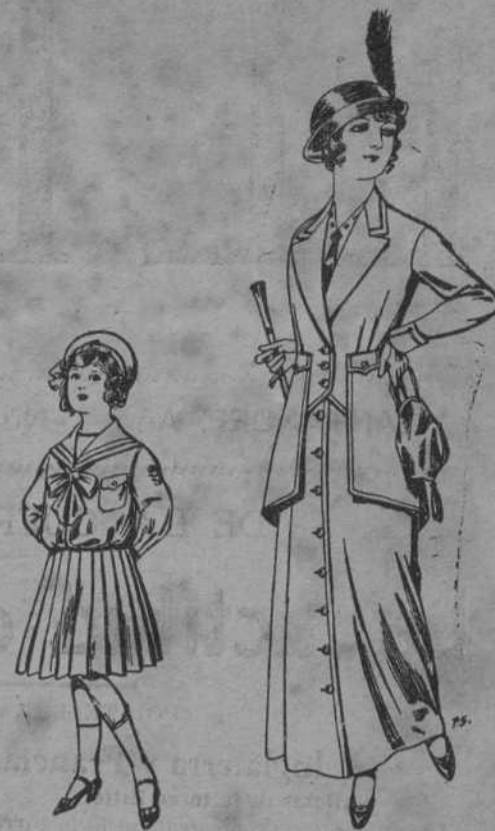
Trajes de lanilla, para niñas de 4 a 12 años azul y color, para señora a pesetas 25 a 35.