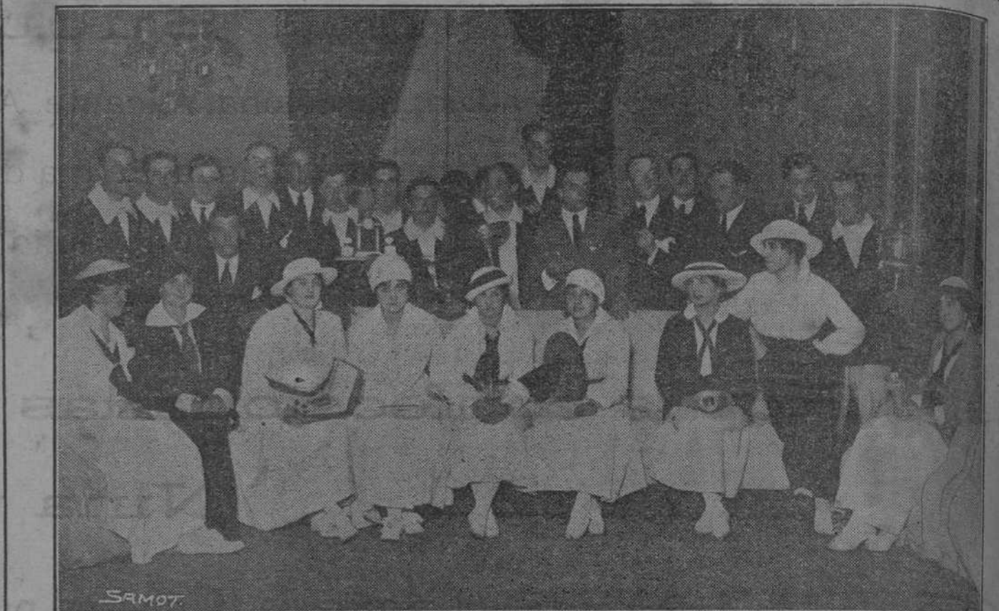
LAS REGATAS DE AYER.—LAS TRIPULACIONES EN EL CLUB, DESPUÉS DEL REPARTO DE PREMIOS

señores conde de Romanones y García Prieto procurarán suavizar las asperezas que existen, para cuando las circunstancias lo reclamen, cumplir todos con su deber.