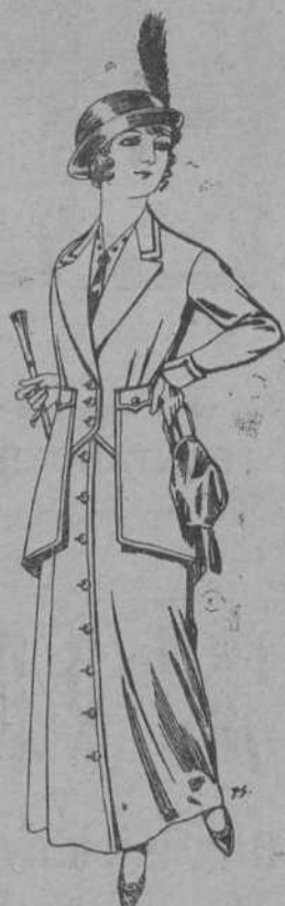
Trajes de lana negra, para niñas de 4 a 12 años azul y color, para señora a pesetas 65.

Ropas confeccionadas para Caballero, Señora, Niña y Niño