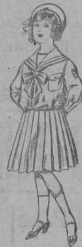
Trajes de lanilla, para niñas de 4 a 12 años azul y color, para señora a pesetas 65.

Madrid, Barcelona, Alicante, Almería, Bilbao, Cádiz, Cartagena, Gijón, Granada, Málaga, Palma de Mallorca, Sevilla, Valencia, Valladolid y Zaragoza