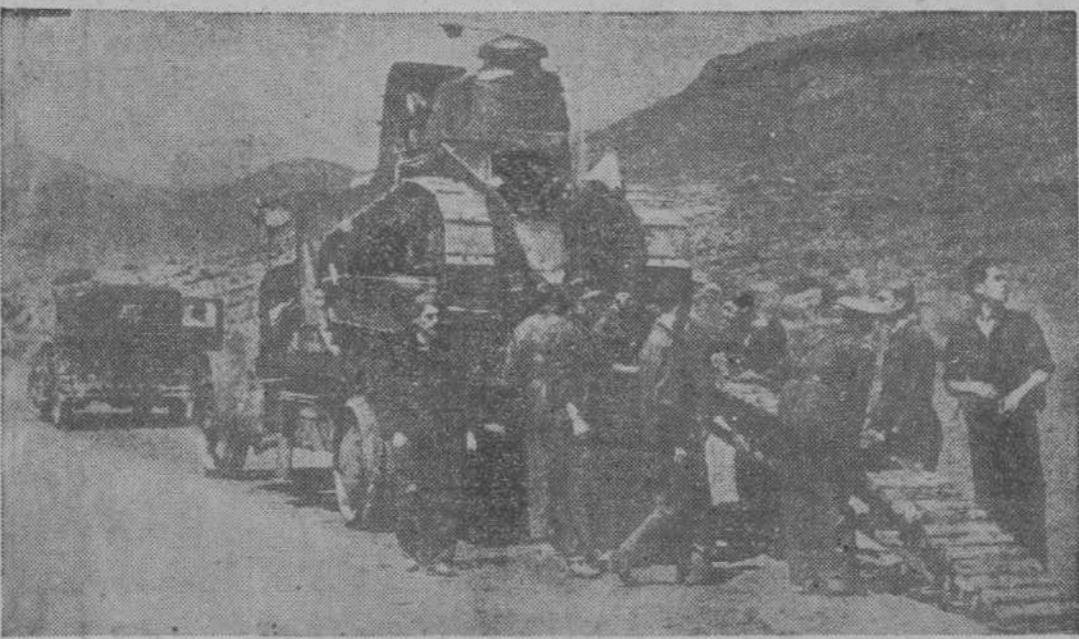
Un tractor de artillería instalado en un camión para su transporte inmediato desde Cataluña al frente aragonés de combate.