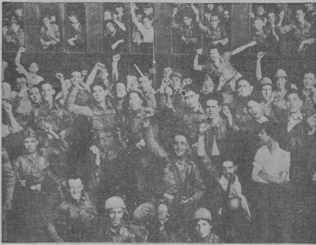
Un destacamento de soldados dispuesto a embarcar en el tren militar que partió de Barcelona en dirección al frente de Aragón.

Aparato digestivo. Cirugía. Radiología. De 12 a 2 y de 4 a 6. PABLO IGLESIAS, 47, CHALET (Parada de tranvía y autobuses: San Martín.) — Teléfono 23-67.