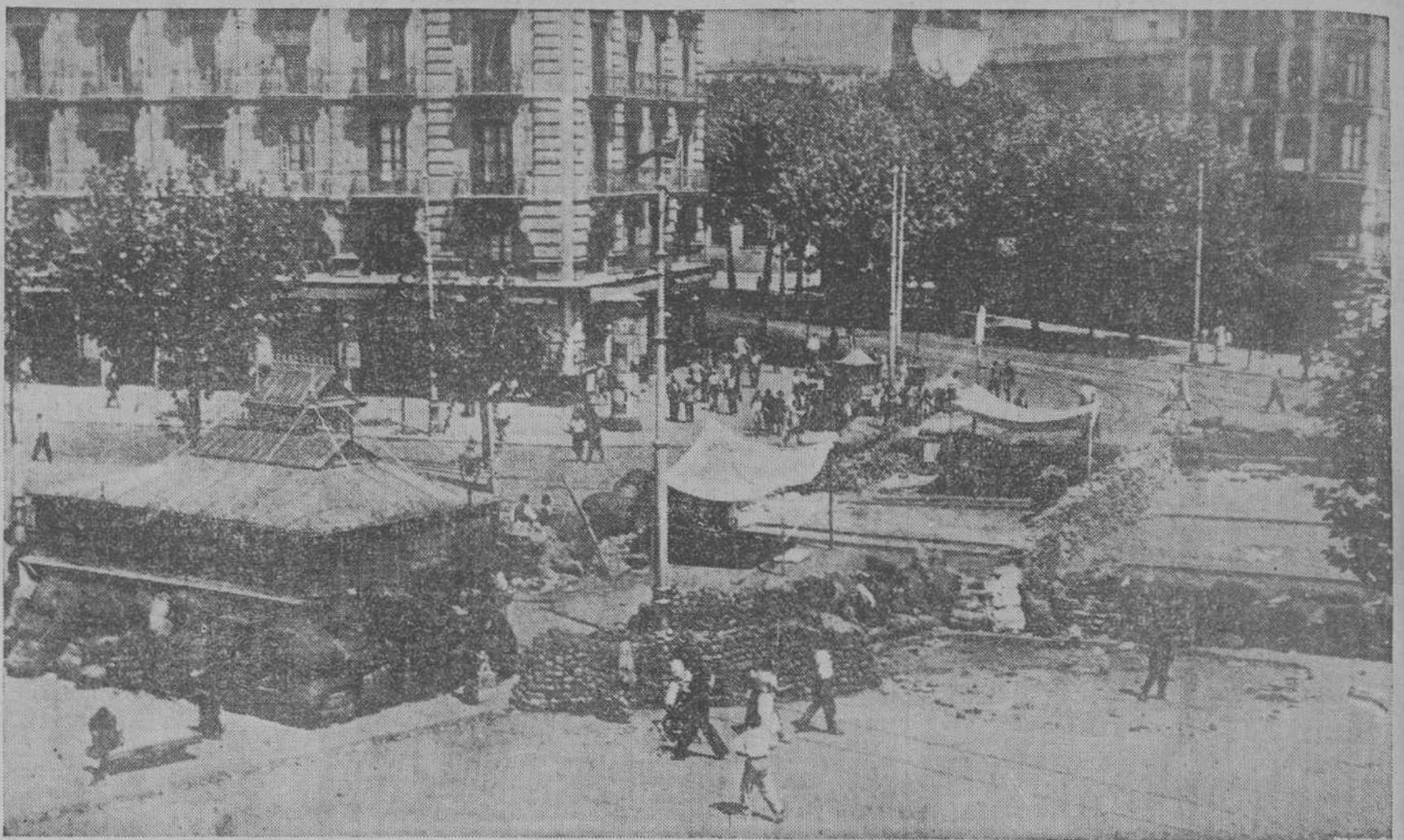
En el Paralelo, de Barcelona, el pueblo levantó estas impresionantes barricadas para repeler el ataque de las tropas fascistas, que se alzaron en armas contra la República.

Entra después en el segundo aspecto de la Fenomenología: la conciencia pura. Como preparación, expone la teoría de la intencionalidad, según Brentano. El rasgo decisivo es éste: mientras que una cosa cualquiera «no es más que un objeto», se agota en ser un objeto; un fenómeno psíquico—un acto de pensar, etc.—«tiene» un objeto. Un acto de la percepción, por ejemplo, no es objeto. El acto consiste en su referencia al objeto. El objeto tiene una existencia en el acto mismo. Un pensamiento absurdo ya tiene existencia en cuanto hay un acto que lo menciona. Esta vez su rasgo definitorio en la intencionalidad, demuestra que nosotros consistimos en algo que, por esencia, es abierto a esos objetos. Así, el acto consiste en un complicar su objeto sin menoscabo de la trascendencia del objeto al acto mismo. La operación esencial de la Filosofía consiste en la reducción fenomenológica.—R. O. F.