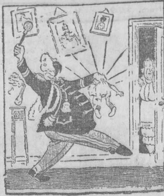
El encargado del bombo en la Banda Imperial se ve obligado a castigar a su hijo.