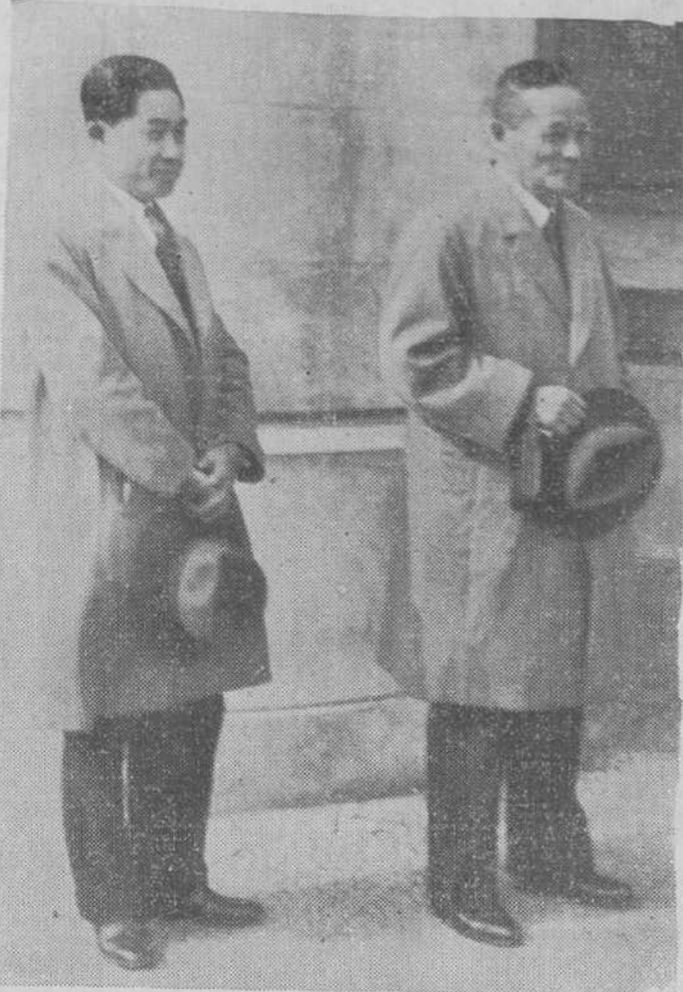
El Embajador del Japon y el Encargado de la Legación.

Se inicia, pues, la semana con evidentes señales de ser en un todo igual a la que ha terminado. A saber: la misma indecisión en las alturas para todo lo que no sea servir a los intereses y pedones de los revolucionarios y el mismo compás de espera hasta que el Congreso socialista se celebre. Su resultado ha de marcar forzosamente el camino a seguir por cuantos tengan plena conciencia de sus actos y de la responsabilidad que les alcanza. Si así no fuera, el delito de complicidad sería manifiesto.