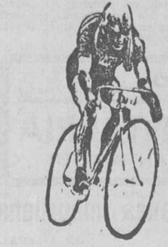
LA GRAN PRUEBA QUE SE CORRERA EN MONTE EL DIA 7

Puntuación de los equipos: C. D. Río de la Pila, 17 puntos. Fortuna Camargo, 15. Peñacastillo, 14. C. D. an Román, 13. Unión Montañesa, 12. CAMPOS DE LOS ARENALES TROFEOS D. B. Y OLIMPIA. —Hoy se jugarán en estos campos interesantes partidos, que sin duda merecerán la atención de la afición que todos los domingos frecuenta este terreno.