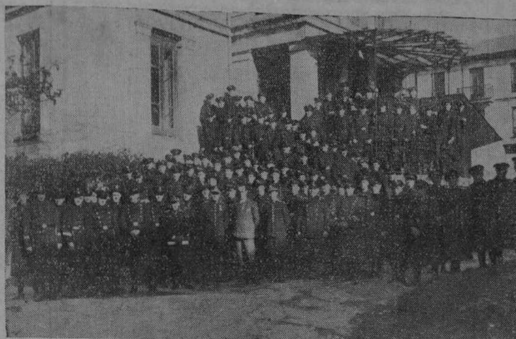
En la mañana de ayer hizo el gobernador civil una visita al edificio donde se alojan las fuerzas de Asalto. En el grupo, la compañía, con sus oficiales, rodeando al señor Mazón.