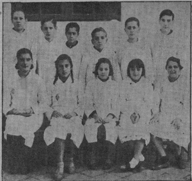
Grupo de Intelectuales niñas y niños del Grupo «Ramón Pelayo», que forman la redacción de un simpático periódico escolar.

La Junta de las Obras del puerto HA TRASLADADO sus oficinas a la calle de CASTELAR, núm. 3, pisos primero y segundo derecha.