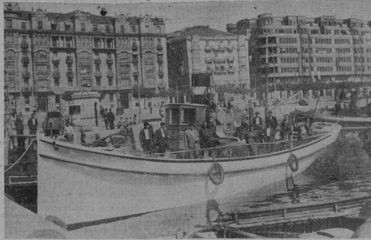
La lanchilla «Menéndez y Pelayo», primera de la serie de cuatro, adquirida por el Gremio de Pescadores.