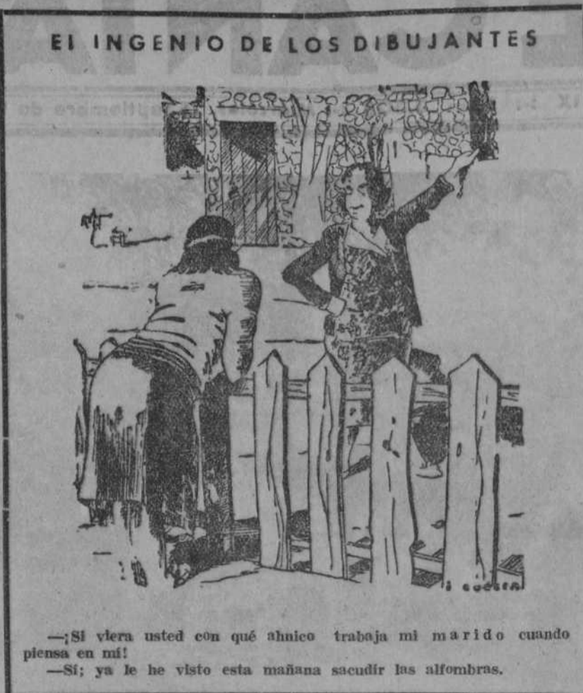
—Si viera usted con qué ahínco trabaja mi marido cuando piensa en mí! —Si; ya le he visto esta mañana sacudir las alfombras.

Se cree que llevan ya varios días muertos y por lo tanto será difícil averiguar quién haya sido el autor de esta gracia. La Guardia civil interviene en el asunto.»