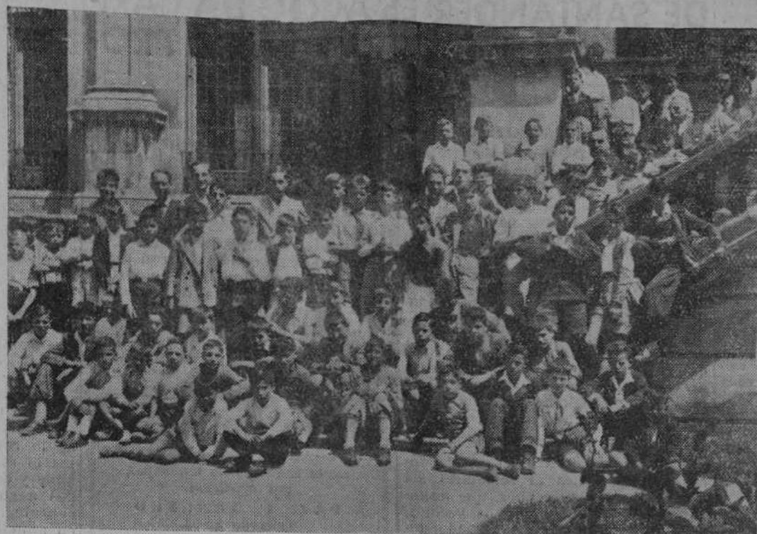
El director del Colegio Sadel, de Santaña, acompañado de los profesores y una sección de alumnos, en su visita a la Biblioteca de Menéndez Pelayo. Los expedicionarios visitaron también los talleres de LA VOZ DE CANTABRIA, donde, después de recorrer las distintas dependencias de nuestra Casa, fueron obsequiados con álbumes de la Cultura Española.

Mag. Hgado, Intelectual de ESCALANTE, 10, 1.º Avisos: Teléfono 1076