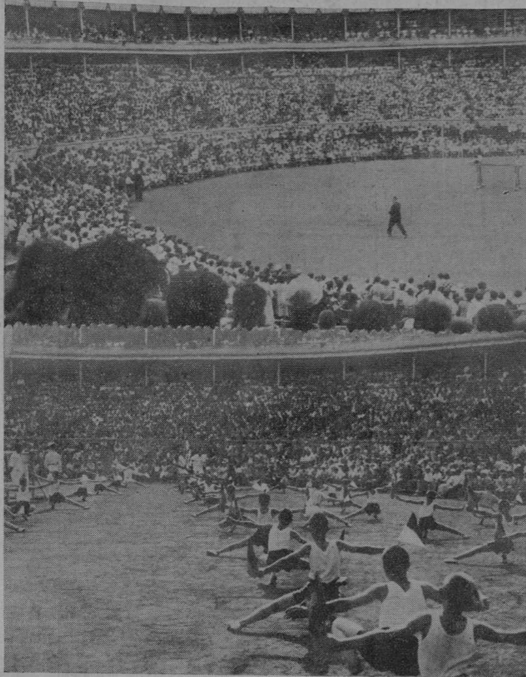
Dos aspectos de la plaza de toros durante el simpatísimo festival de ayer, organizado por el Sindicato de Iniciativas, y al que asistieron más de catorce mil niños santanderinos.

Amo, Hígado, Intestino, AMOS DE ESCALANTE, 10, 10 Avisos: Teléfono 1036