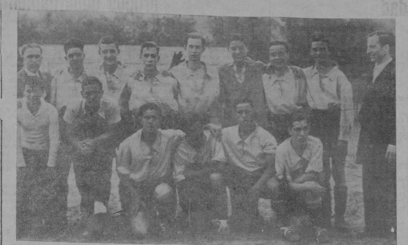
EN EL ALTA.—La final infantil del Trofeo Don Bosco.

El pasado domingo se jugó en el campo de deportes del Colegio del Paseo del Alta la interesante final del Trofeo Don Bosco (Categoría infantil), cuyo torneo han organizado con tanto éxito entusiastas deportistas antiguos alumnos salesianos.