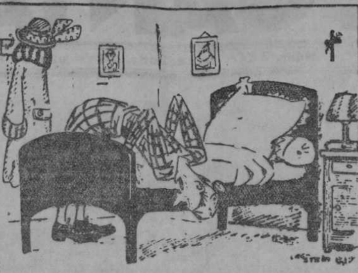
LA LECTORA DE NOVELAS POLICIACAS.—¡Secorro! ¡Veo unos pies debajo de la cama!