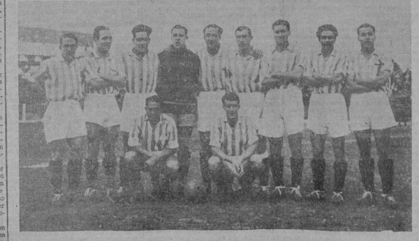
He aquí el equipo que alineó el Betis el domingo en los Campos de Sport y que remató su brillante jornada de la Liga con los dos puntos que necesitaba para ser campeón.