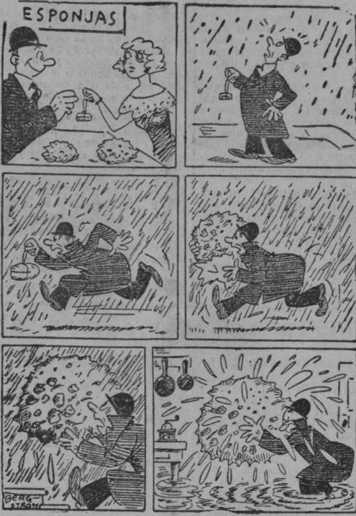
Anacleto tiene la ocurrencia de comprar una esponja en día de lluvia.