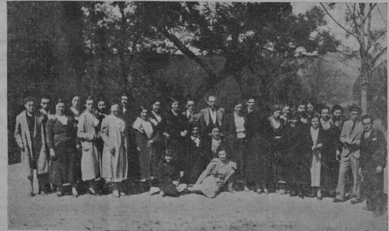
Los nuevos maestros del Valle de Igüña, reunidos en las proximidades de Alfamira, durante la visita que hicieron recientemente a Santillana y a las famosas cuevas prehistóricas.

Tarjetas de visita EDITORIAL MONTANESA Marcos Linazasoro, 19. Teléfono 15-55