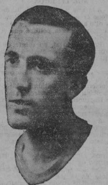
CEBALLOS Sampierdarena, 15; Livorno, 14; Pro Vercelli, 10.

ROMA.—Los resultados de los encuentros del campeonato italiano disputados ayer, dieron estos resultados: Juventus, 2; Livorno, 1. Alejandria, 3; Triestina, 0. Fiorentina, 0; Sampierdarena, 0. Roma, 4; Ambrosiana, 3. Milán, 1; Lazio, 1. Pro Vercelli, 0; Turín, 3. Brescia, 0; Nápoles, 1. Palermo, 0; Bolonia, 0. La clasificación queda establecida así: Juventus, 33 puntos; Fiorentina, 32; Ambrosiana, 32; Roma, 25; Palermo y Nápoles, 22; Milán y Triestina, 21; Brescia y Torino, 18;