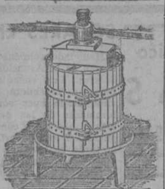
Prensas para uva y manzana desde 70 Ptas. Estrujadoras para uva. Machacadoras para manzana.

GARAJE Sancho se venden coches usados de distintas marcas. Verdadera ocasión.