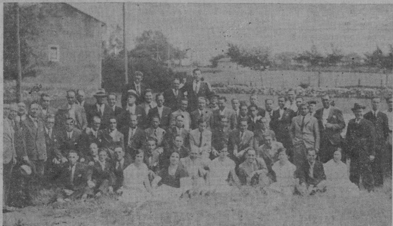
Grupo de comensales al banquete celebrado ayer en la Albercía para festejar el "Día del Viajante."

Rogamos a cuantas personas quisieran favorecernos con donativos, se apresuren a enviarlos a esta benéfica institución.