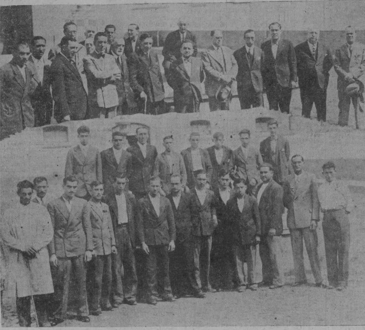
La Junta de Fomento Pecuario y los ganaderos que asistieron ayer en la Estación Pecuaría a la inauguración de los cursos de manufacturas lácteas.—Abajo, los jóvenes ganaderos que participaron en los cursillos.

En la estación Pecuaría de Campogiro se verificó ayer mañanero el importante acto inaugural de los cursillos de prácticas de fabricación de quesos y mantecas, organizados, como se sabe, por la Junta provincial de Fomento Pecuario, con la cooperación del director general de Ganadería. Este envió un equipo móvil de industrias lácteas. Al acto asistió la Junta en pleno de Fomento Pecuario, que fué recibida, en nombre del director de la Estación, por el director del Instituto de Biología animal, don Carlos