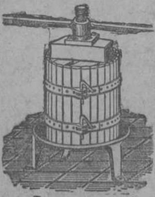
Prensas para uva y manzana desde 70 Ptas. Estrujadoras para uva Mechadoras para manzana