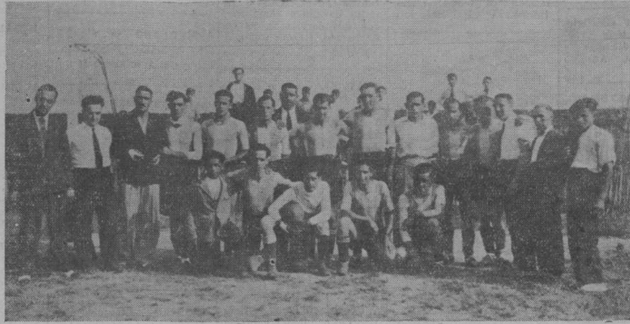
UNION TORANCEÑA, de Villasevil.—Los animosos muchachos de Toranceño, acompañados de su presidente y varios directivos, posan para LA VOZ DE CANTABRIA momentos antes de comenzar a jugar su encuentro decisivo con el C. D. Cueto, con el que empataron el pasado domingo en los Arenales, después de una interesantísima actuación.