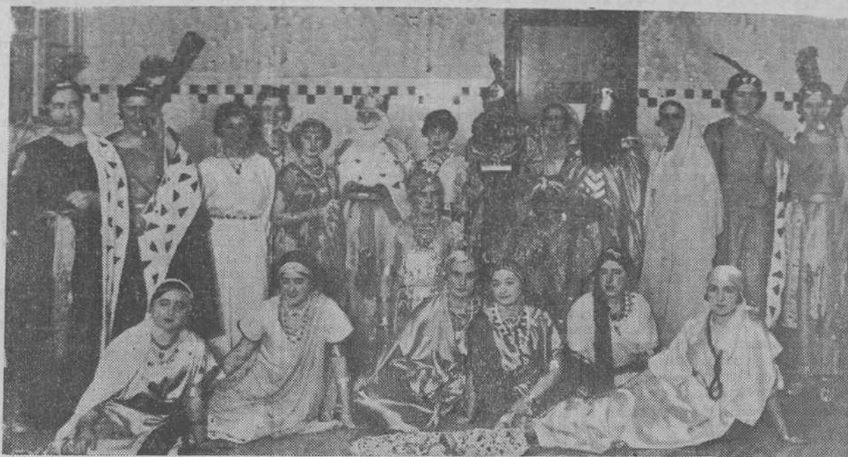
Las bellas enfermeras de la Casa de Salud Valdecilla, interpretando una iniciativa generosa, repartieron ayer tarde juguetes entre los niños hospitalizados. Se organizó una vistosísima corte, que acompañó por los pabellones a los Reyes Magos, y la fiesta resultó encantadora.

Acordado el funcionamiento de una cantina escolar en este grupo, se pone en conocimiento de los padres de los niños que asisten al mismo que para poder participar en esta cantina necesitan llenar un impreso que se les facilitará en la misma escuela, en cuyo impreso han de hacer constar las condiciones que reúnen, para elegir de entre los solicitantes los que a juicio de la Comisión tengan mayores derechos.—El director.