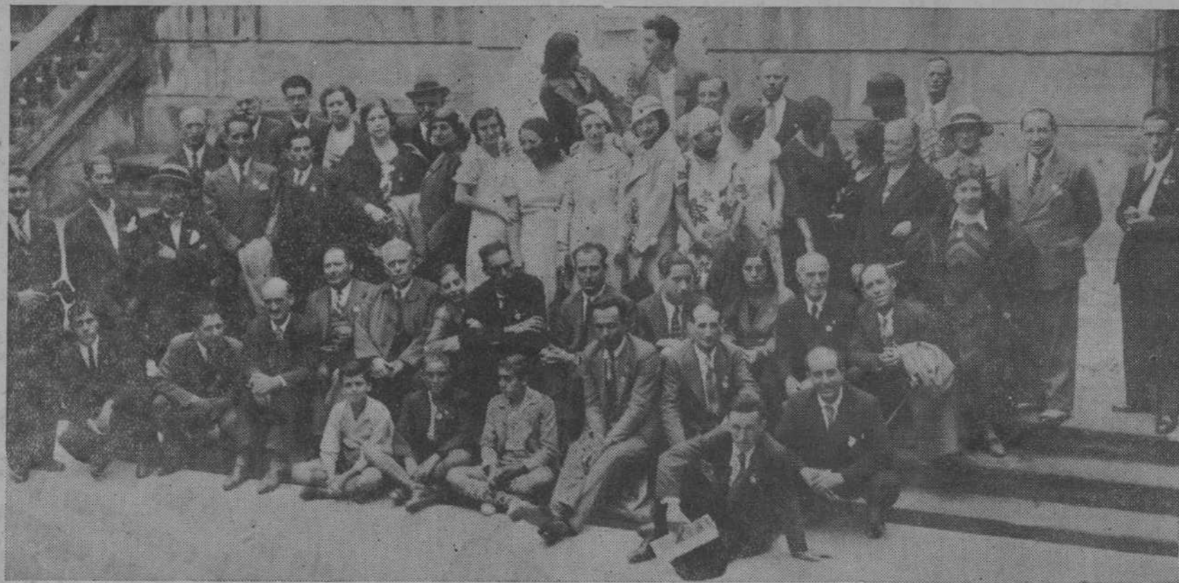
Grupo de congresistas durante la visita que efectuaron ayer a la Biblioteca de Menéndez Pelayo.