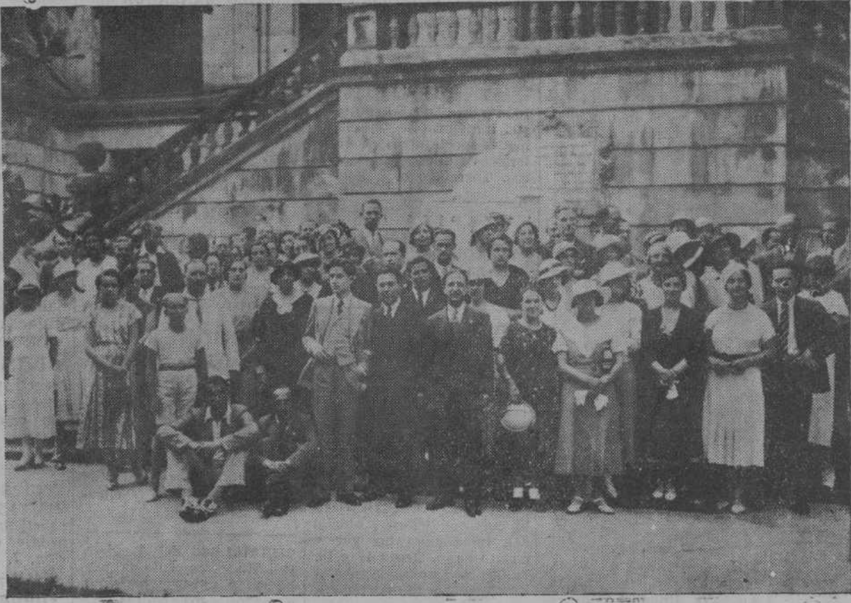
Grupo de estudiantes y profesores del curso de extranjeros de la Universidad Internacional que visitaron ayer la Biblioteca de Menéndez Pelayo.