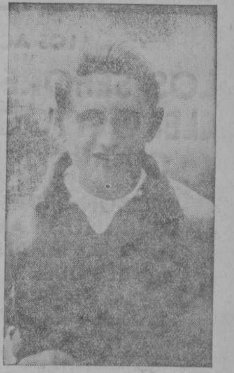
VICENTE TRUEBA. El escalador montañés que en la Vuelta a Francia ha quedado clasificado como el caso de los escaladores, sonríe ante el objetivo que ha de reflejar su efigie, hoy de actualidad mundial y deportiva.