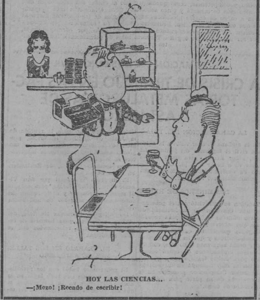
HOY LAS CIENCIAS... —¡Mezo! ¡Recado de escribir!