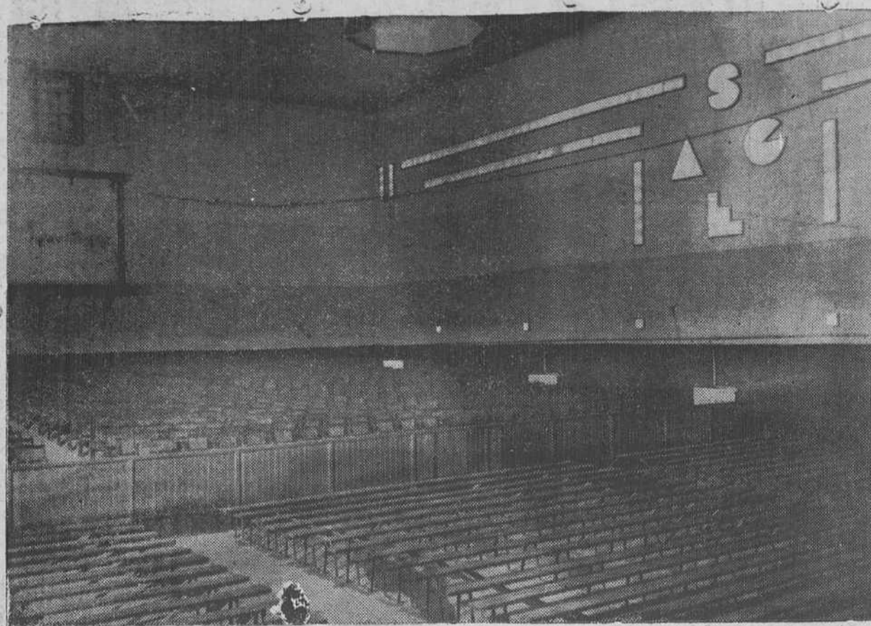
Aspecto de la sala del Cine Frontón después de las grandes reformas realizadas por la Empresa.