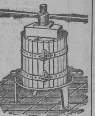
Prensas para uva y manzana desde 70 Ptas. Estrujadoras para uva. Mochecedoras para manzana.

PROFESORA TAQUIMECANOGRAFIA. Ortografía y Gramática. Enseñanza casa y domiciliariamente. Precios reducidos. Plaza Vieja, 6, primero. Teléfono, 32-66.