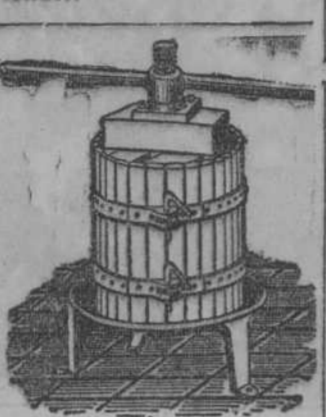
Prensas para uva y manzana desde 70 Ptas.