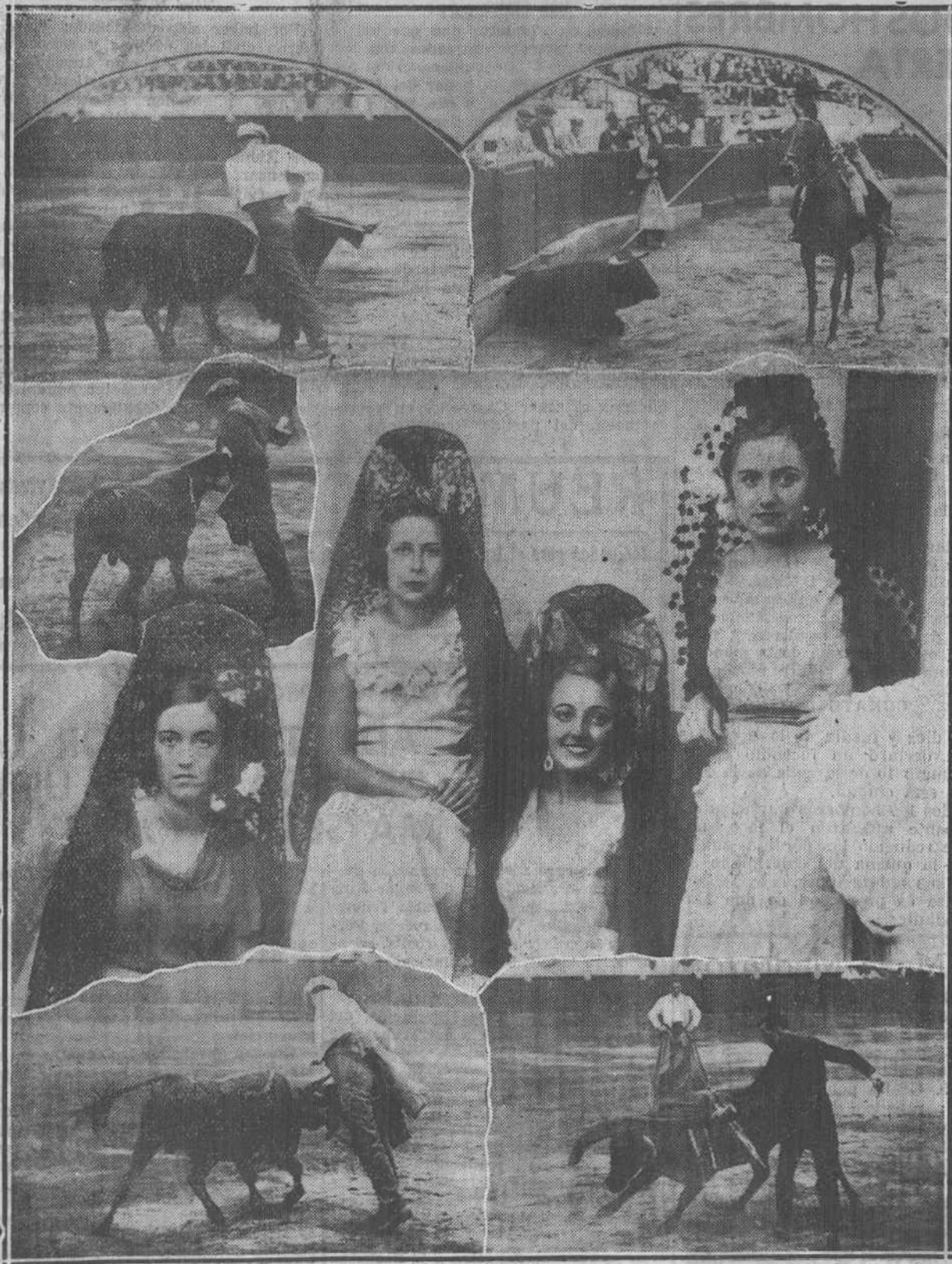
Fiesta popular la becerrada a beneficio de los Hermanitos y fiesta de arte. El grabado es una acertada expresión gráfica de la significación del festival. Bordado con marco bizarro y alegre de momentos de la lidia, ved ahí el españolismo cuadro de las cuatro presidentas, ¡Mujeres santanderinas, madrinas de todo estímulo santo y noble de caridad!...