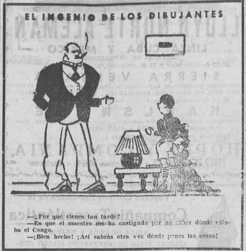
—¿Por qué vienes tan tarde? —Es que el maestro me ha castigado por no saber dónde estaba el Congo. —Buen hecho! Así sabrás otra vez dónde pones las cosas!

La farsa cómica en tres actos, original de don CARLOS ARNICHE, PARA TI ES EL MUNDO