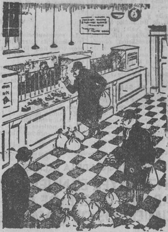
—Bien. Ahora denos algo de calderilla para tomar el tranvía.