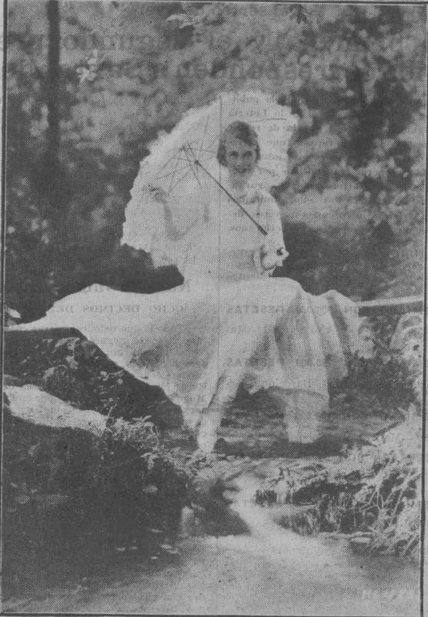
Hollywood ha lanzado una nueva película. Las agencias dicen que es algo sensacional. He aquí a la bellísima Colleen Moore en una escena de la nueva cinta.