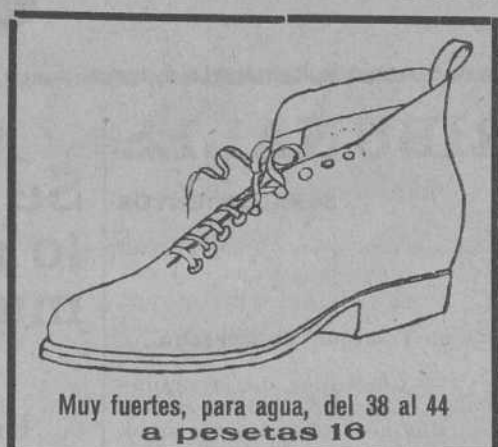
Muy fuertes, para agua, del 38 al 44 a pesetas 16

Pedid estos modelos fijandoos en sus detalles y en sus precios