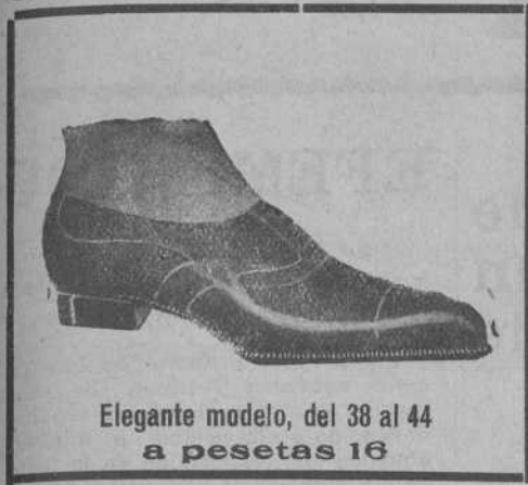
Elegante modelo, del 38 al 44 a pesetas 16

¿QUIEN VENDE EL CALZADO MAS BARATO EN SANTANDER?