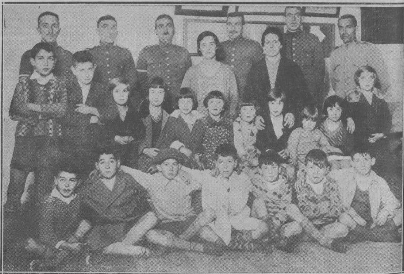
EN TORRELAVEGA.—Guardias civiles del cuartel de Torrelavega, a quienes vendió sendas participaciones del segundo premio el ciego de Sierrapando, rodeados de sus familias.

—Únicamente—dijo—jugaría un duro, porque en el caso de tocar habría ya para algo.