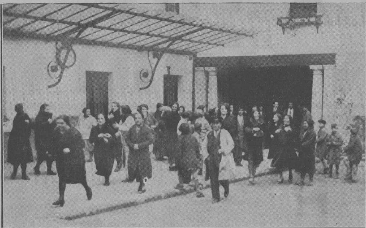
Aspecto del patio de la Fábrica de Tabacos al saberse la noticia de que casi todas las cigarreras eran agraciadas.

calle de Segismundo Moret, número 25, quinto piso, no se ha quedado ni con una sola de las papeletas que en tanta cantidad ha repartido. El, a la puerta de la Fábrica de Tabacos, y su madre política, cigarrera también, en algunos talleres, han repartido la casi totalidad de las trescientas participaciones en los tres vigésimos, en mayor proporción, seguramente, su suegra, a la que se conoce entre las compañeras de la Fábrica por el sobrenombre de "La Pasiega".