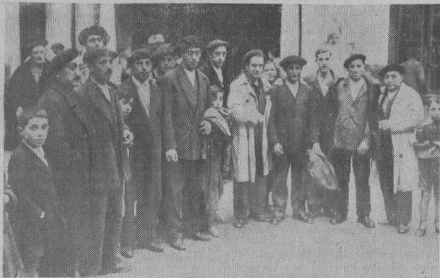
Grupo de operarios de la fábrica de tabacos agraciados con el segundo premio.— (Foto Alejandro)

podría ver lograda su única aspiración, que era la de abrazar a un hijo suyo residente en Lima.