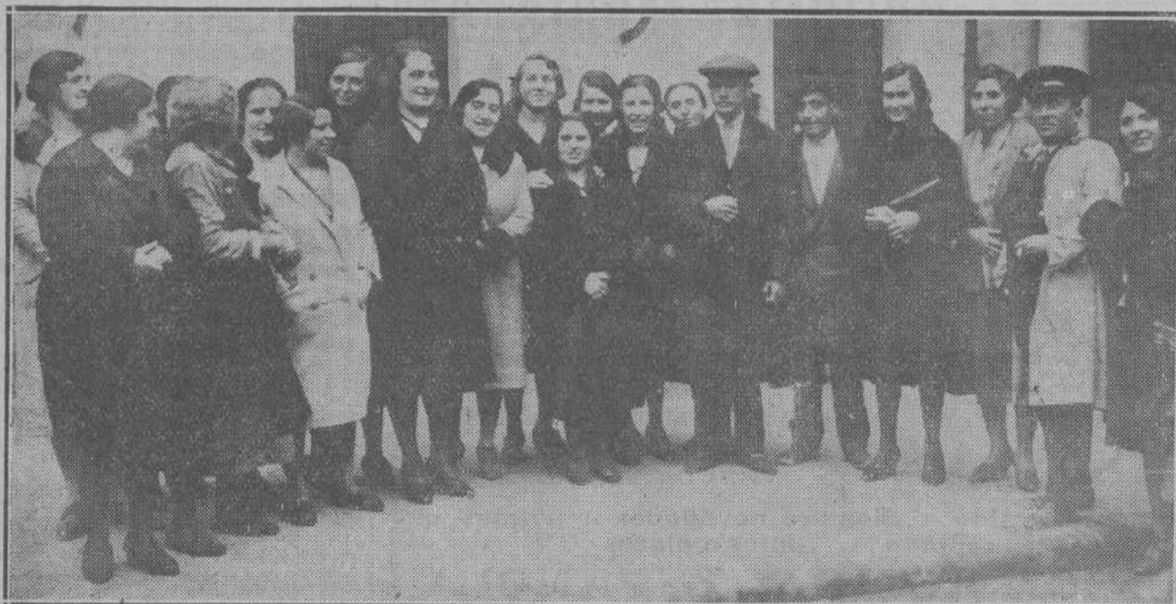
Estas jóvenes cigarreras santanderinas son doblemente agraciadas: por su cara y por su suerte, que les deparó el segundo premio.