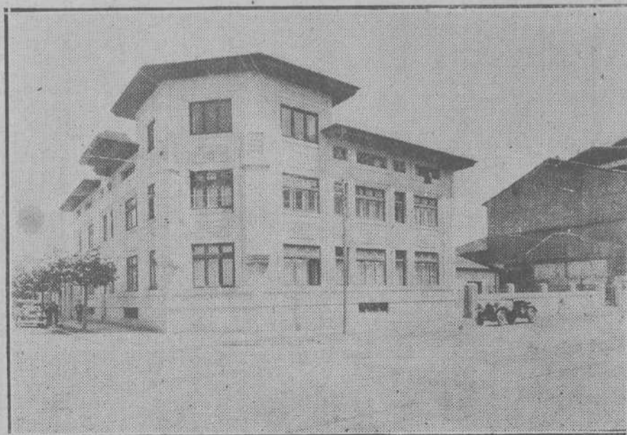
El magnífico edificio del Instituto provincial de Higiene que ayer quedó inaugurado oficialmente.