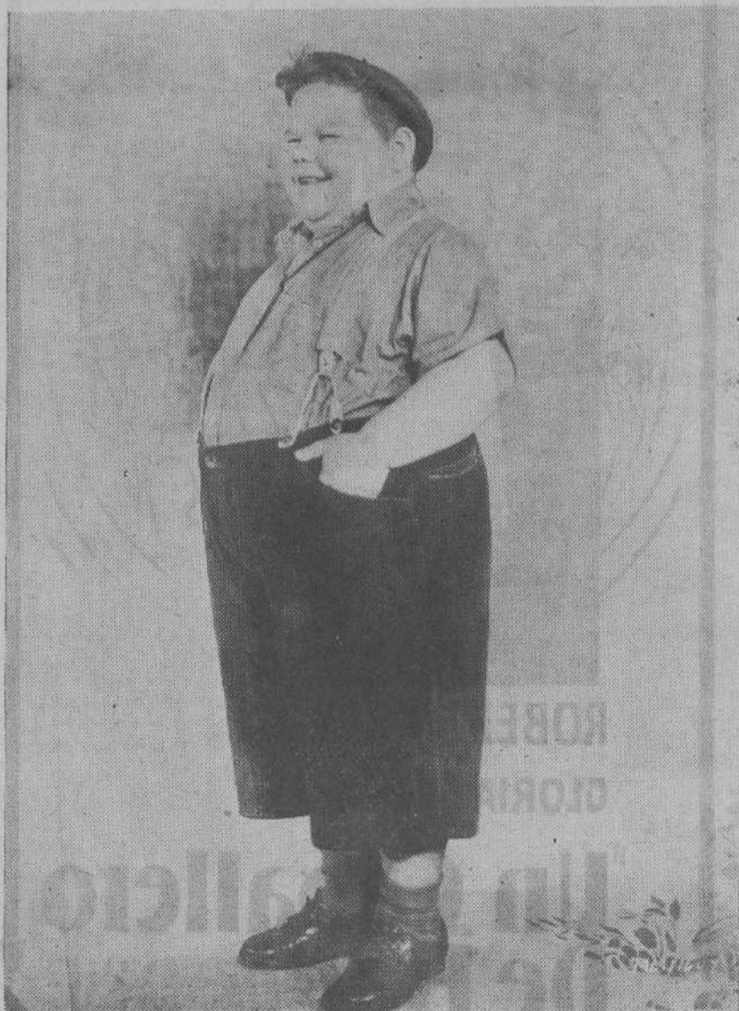
LAS FIGURAS DE LA PANTALLA.—¿Quién no conoce al «Gordito» de «La Pandilla»? He lo aquí, con su sonrisa bonachona y sus seis arrobos de humanidad, quilo más, quilo menos. El «Gordito» es ya un personaje. Pero, andando el tiempo, acaso lo veamos de ministro de Hacienda o de alcalde de New York. Parece que se extiende la moda de elegir señores de buenas carnes para ciertos elevados cargos...

«La autoridad tiene el derecho, y el deber, de impedir la propagación del uso de armas, porque, en buenos principios, el ciudadano no debe usarlas. Y aquel derecho y aquel deber se