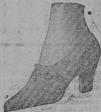
De buena piel de color, a 12 ptas.