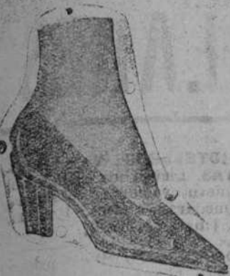
De charol, a 15 pesetas