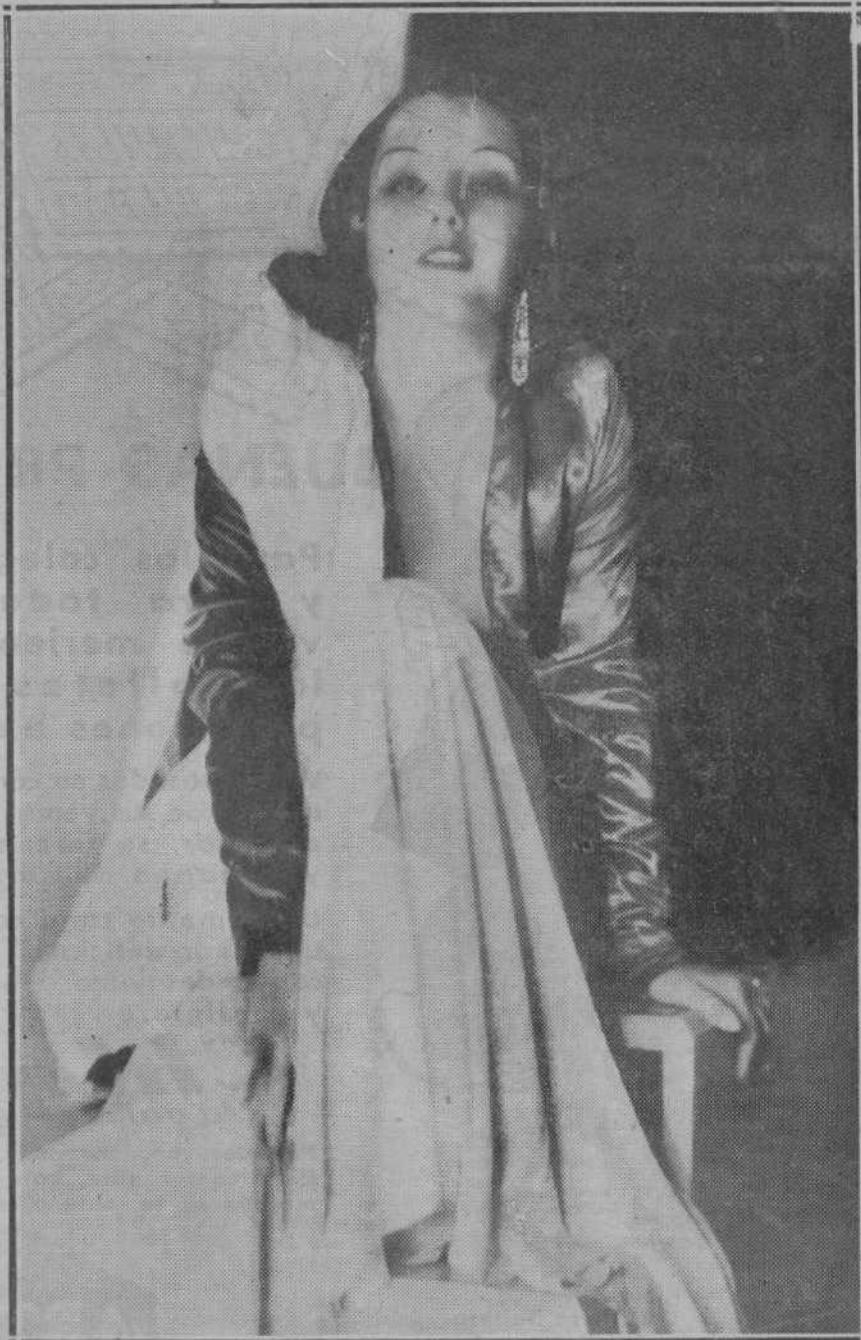
LAS DAMISELAS DEL CINEMA

En otro lugar del periódico, los dirigentes de la Organización Obrera Telefónica (U. G. de T.) declaran que la huelga planteada es francamente perturbadora.