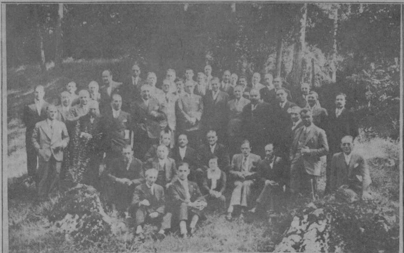
EN HOZNAJO.—Señores que asistieron al banquete celebrado ayer con motivo de la terminación del cursillo de inspectores farmacéuticos municipales, verificado en el Instituto provincial de Higiene de Santander.

nador civil de una provincia porque no había acudido a presentarse y rendirle homenaje cuando llegó a la capital. Han pasado de esto varios días. La autoridad militar sigue en su puesto.