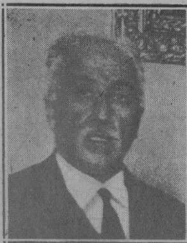
Don Niceto Alcalá Zamora.

Aquel hombre del descomunal cuello de pajarita, siempre acechado, seguido cautelosamente por hombres llegados quién sabe de qué repliegue de la Sierra Morena, levantó bien pronto a la conciencia popular en armas espirituales contra el poder invasor del cacique. Ya no iba de un lado a otro de la ciudad rodeado de un grupo de hombres liberales; ya le seguía el pueblo, en